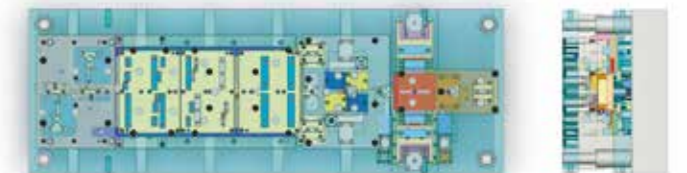
Precision Tool System, USご提供